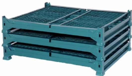
折畳み段重ね状態