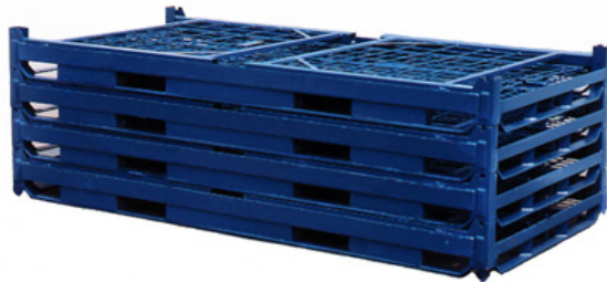
折畳み段重ね状態