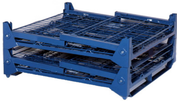
折畳み段重ね状態