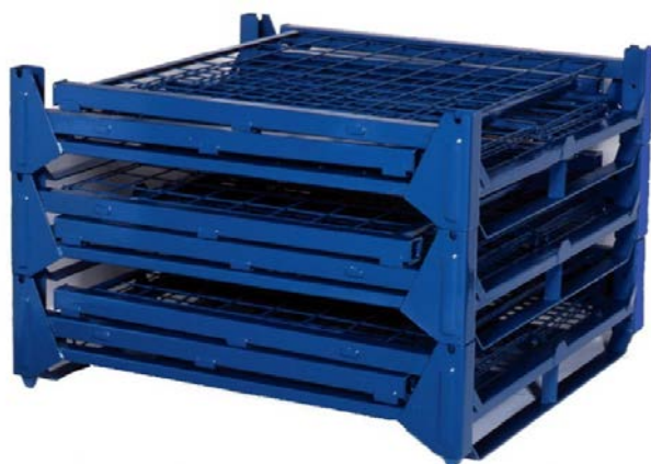
折畳み段重ね状態