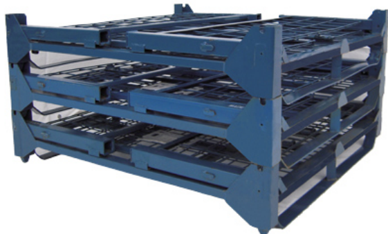
折畳み段重ね状態